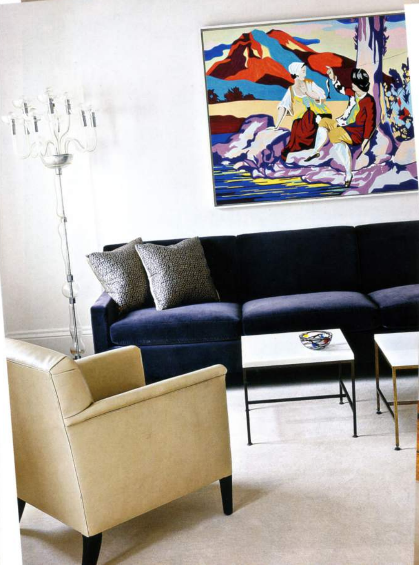
VISTA GENERAL DE UNO DE LOS SALONES. MESA Y SILLAS DE WILLIAM HAINES DE LA RESIDENCIA DE HOLLYWOOD DE JACK WARNER, Y, EN LA PARED, TRIPTICO DE HILDA & BERNARD BECHER. A LA IZDA, BAJO LA PINTURA DE DAVID SALLE, SOFÁ Y SILLÓN HERBERT DE VICA, LÁMPARA DE CRISTAL DE CARLO SCARPA Y COFFEE-TABLES DE PAUL McCOBB. ABAJO, LIENZO DE ROSS BLECKNER. EN LA OTRA PÁGINA: LA COCINA COMBINA MADERA LACADA EN BLANCO, MÁRMOL Y ACERO INOXIDABLE, TODO DISEÑADO A MEDIDA POR EL ESTUDIO DE SELLDORF ARCHITECTS. LAS LÁMPARAS SON DE WILLIAM LESCAZE DE UN DINER DE LOS 50.